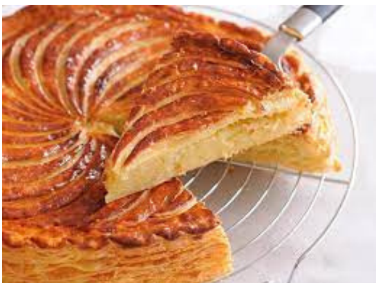
Illustration : Hervé cuisine

Comment appellent-on les collectionneurs de fèves ?.